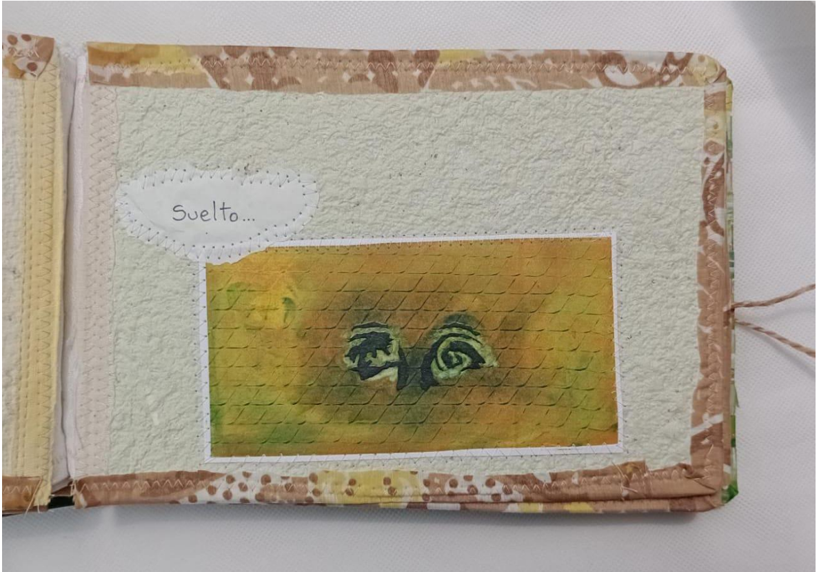
Fragmento de Libro de Artista, Ruiz, Carla, 2022. Viedma.