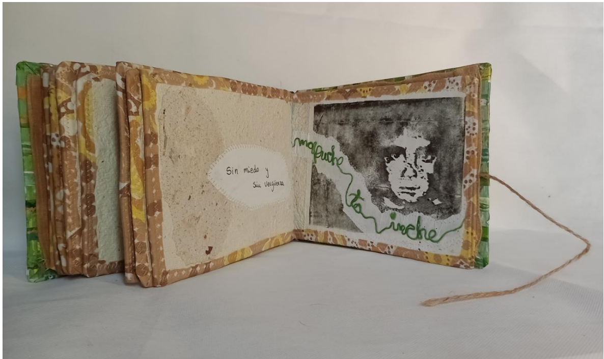
Fragmento de Libro de Artista, Ruiz, Carla, 2022. Viedma.

-Qué rol consideras que ocupa o tendría que ocupar el arte en la sociedad.